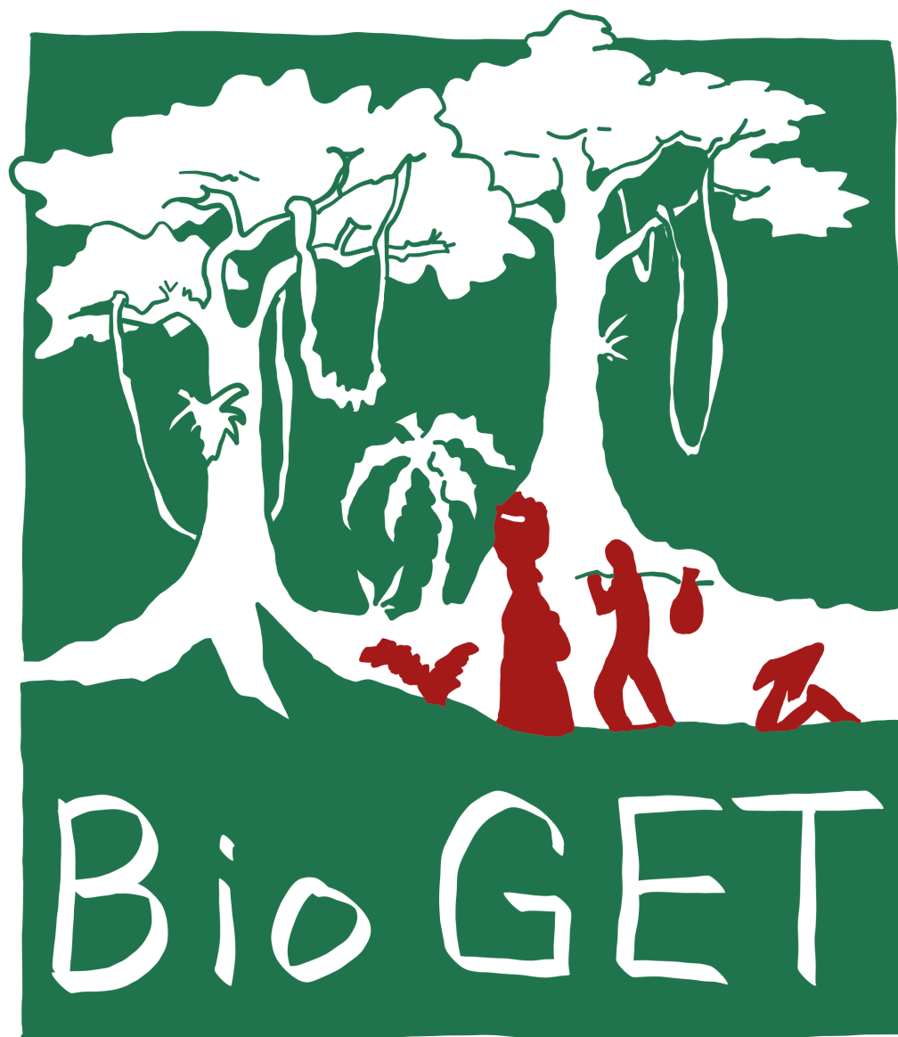
FIGURE A.2 : Logo de BioGET